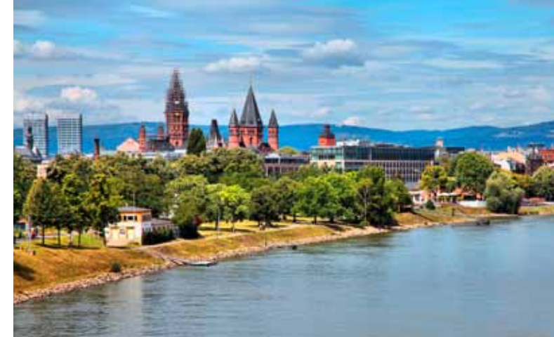
15 Mainz belegt Platz zwei des Cash.-Rankings. Die Landeshauptstadt von Rheinland-Pfalz zeichnet ein hohes BIP-Wachstum, eine niedrige Arbeitslosenquote und eine hohe Anzahl von Firmengründungen aus.