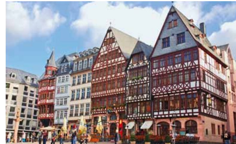
15 Frankfurt am Main: Die Siegerstadt des Cash.Rankings 2012 rutschte dieses Jahr auf Platz drei. Die Mainmetropole zählt nach wie vor zu den dynamischen Immobilienstandorten, mit hoher Wirtschaftskraft, aber auch hohen Preisen.