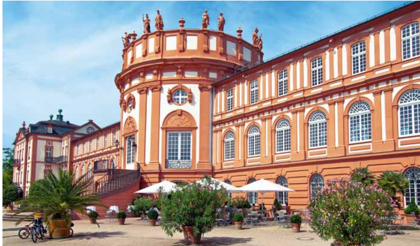
6 Wiesbaden: Die hessische Landeshauptstadt ist Sieger des 40-Städte-Rankings von Cash. Neben stabilen Wirtschaftsdaten konnte der Immobilienmarkt der Kurstadt mit hoher Nachfrage und attraktiven Renditen punkten. Generell liegen prosperierende B-Städte im Aufwärtstrend. Im Vergleich zu teuren Metropolen sind Immobilien hier noch zu moderaten Preisen zu haben, die Anlegern gute Mietrenditen in Aussicht stellen.