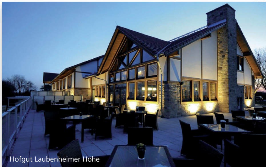
Hofgut Laubenheimer Höhe

Der Veranstaltungspreis schließt folgende Leistungen ein: Tagungsunterlagen, Tagungsgetränke und Business-Lunch sowie das Abendevent.