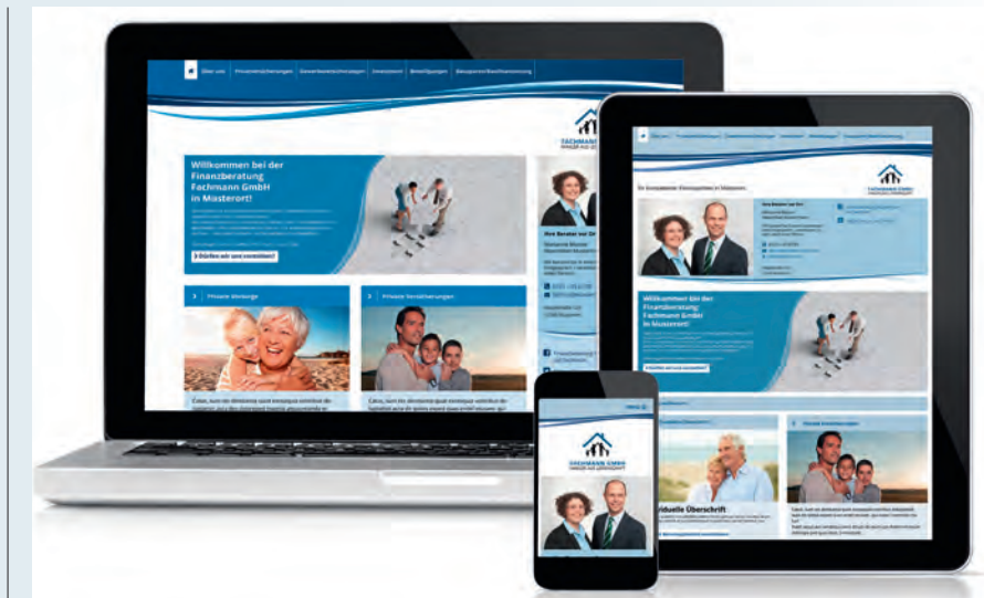
Der BCA-Webseitenmanager für Websites im responsiven Design – standort- und endgeräteunabhängig.

Speziell für den Versicherungsbereich bietet sich mit dem innovativen BCA-Tipp eine weitere maßgeschneiderte Orientierungshilfe an. Mittels effektiven Versicherungssupports erfahren BCA-Partner nunmehr eine spürbare zeitliche Entlastung im Beratungsprozess. Über wenige Klicks hinweg ermöglicht es das Tool, dass je nach Versicherungssparte und entsprechender Kundenanfrage passgenaue Tarife selektiert und für den Makler aus-