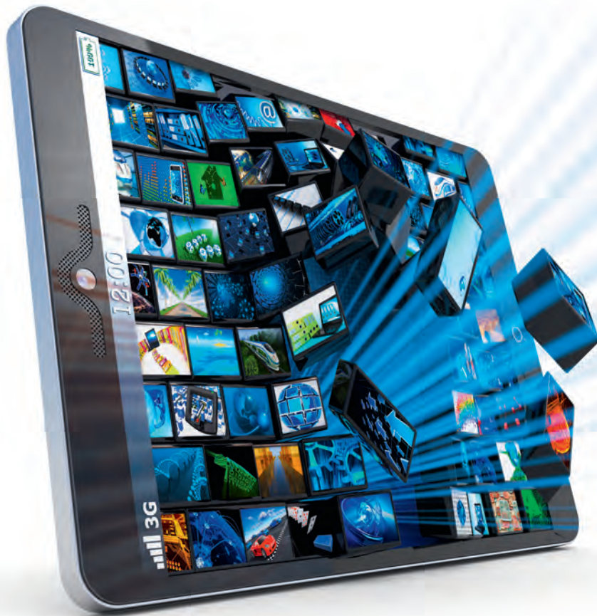
Fintechs wollen Geldanlage und Versicherungsvertrieb revolutionieren.

DIGITALISIERUNG Lange ging die Finanz- und Versicherungsbranche davon aus, von der digitalen Revolution verschont zu bleiben. Doch Fintechs, Insurtechs und Robo Advisors sind angetreten, die etablierten Player das Fürchten zu lehren.