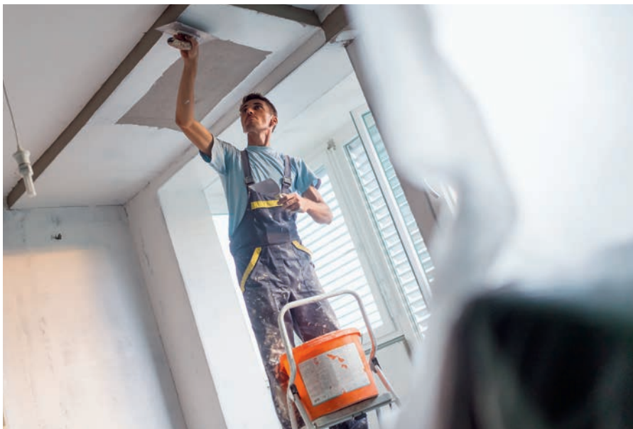
Die BU-Versicherung bietet Schutz gegen das Risiko „Verlust der Arbeitskraft“.

Hier sei als wichtigste biometrische Absicherung die Berufsunfähigkeitsversicherung zu nennen. „Unsere Philosophie in der Berufsunfähigkeit lautet: Es kommt in der Versicherung auf das Gesamtpaket und nicht auf einzelne herausgehobene Features an. Wir stellen dem Makler ein Paket zur Verfügung, in dem alle Leistungsmerkmale stimmen. So erhalten seine Kunden ei-