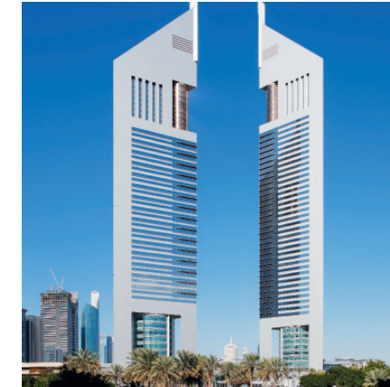
48 Frontier Markets Dubai – Arabien ist einer der Hoffnungsträger für Anleger.

Fonds, die ethische, soziale und ökologische Kriterien berücksichtigen, liefern solide Renditen und Anlegern ein sauberes Gewissen.