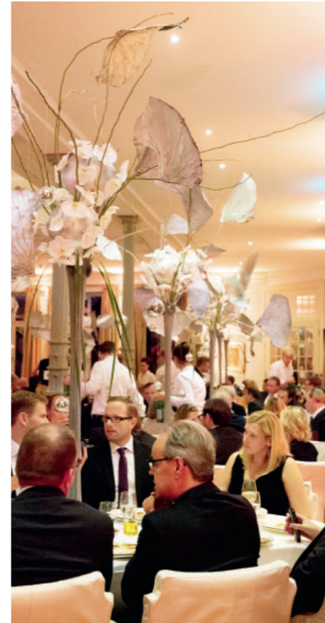
12 Cash.Gala Der Top-Event auf dem Süllberg in Hamburg-Blankenese führte erneut die Entscheider der Finanzbranche zum Networking zusammen.