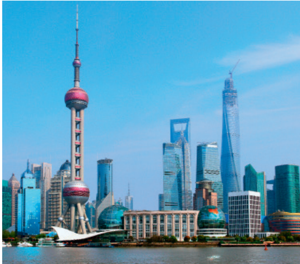
30 Emerging Markets Die Schwellenländer China und Indien konnten in den vergangenen Jahren Aktienanleger trotz enormer Wachstumsraten ihrer Volkswirtschaften nur bedingt erfreuen. Nun soll alles besser werden. Wachstumsmotoren wie Shanghai (Foto) oder Mumbai sollen es richten und für gute Investment-Stories sorgen.

LVRG bedroht Neugeschäft/ Neues Trio für Axa/Helvetia mit neuer Fondspolice/Cyber-Police von BNP Paribas Cardif/Vermittler wollen sich weiterbilden/Makler steigern Marktanteile/Fondspoli- cen-Rating von Morgen & Morgen