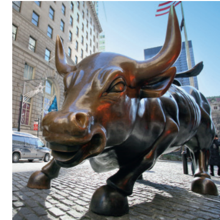
28 USA-Aktien Der Bulle holt Schwung. Experten erwarten steigende Kurse.

Südafrika, Nigeria, Ägypten – die Grenzmärkte in Afrika und Arabien haben das Potenzial in die erste Riege der Schwellenländer aufzurücken.