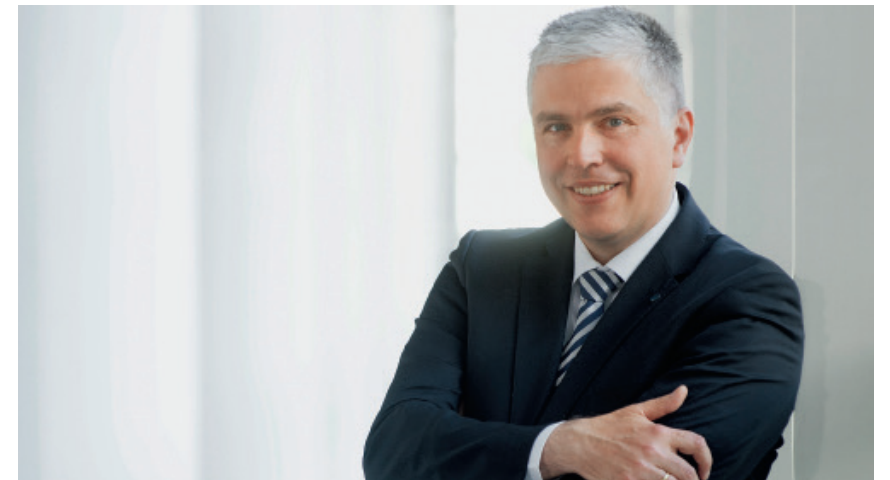
28 Indexpolizen: Um den Altersvorsorgegedanken im Versicherungsbereich weiter zu beflügeln, setzen die Assekuranten verstärkt auf kapitalmarktnahe Produkte. Laut Jürgen Voß von der Nürnberger nutzen sie die Chancen an den Börsen und bieten ein Mindestmaß an Sicherheit.