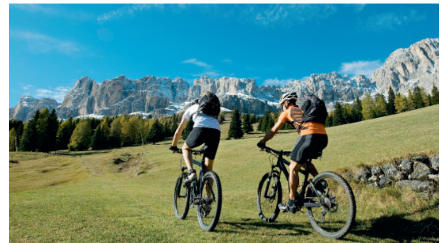
64 Unfallpolizen: Die Absicherung von Hobbysportlern gegen mögliche Risiken ist besonders wichtig. Doch auch bei Tätigkeiten im Haushalt ist eine gute Unfallversicherung von großer Bedeutung.