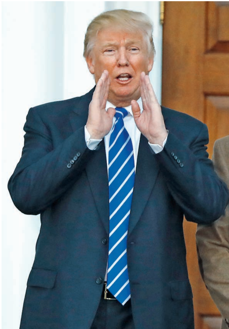
12 Aktienmärkte nach der US-Wahl Donald Trump, der künftige US-Präsident, gilt als Symbol für Unsicherheit. Dennoch können Investoren von seiner Politik profitieren