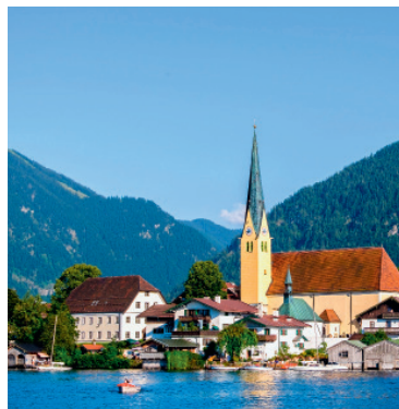
Bergidyll am Tegernsee: Bayern ist eines der beliebtesten Ferienziele

Ferienimmobilien dienen vielen Deutschen nicht nur zur Erholung, sondern sind auch zunehmend eine Kapitalanlage. Die lukrativsten Standorte, und welche Kriterien ein Investment erfüllen sollte