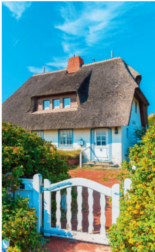
62 Ferienimmobilien Der Charme von Insel-Objekten auf Anleger ist ungebrochen.