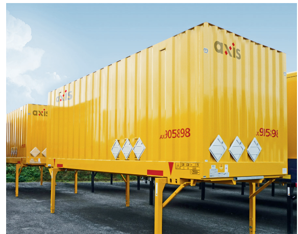
Wechselkoffer haben ein- und ausklappbare Stützbeine.

Die Branche der Paketdienste (KEP-Branche) legt seit Jahren beeindruckende Wachstumswahlen vor. Die Sendevolumina von DHL, DPD, Hermes, UPS und anderen wuchsen von 2015 auf 2016 um 7,2 Prozent. Täglich werden in Deutschland im Durchschnitt mehr als acht Millionen Pakete ausgeliefert, in der Weihnachtszeit sind es über elf Millionen. Die Transportbehälter, unter anderem die Wechselkoffer, nehmen eine wichtige Stellung in der Logistikkette ein: Sie dienen als Schutz, als Behältnis, aber auch als