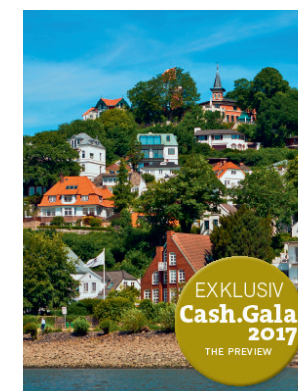
Cash.Gala Das Preview Seite 49