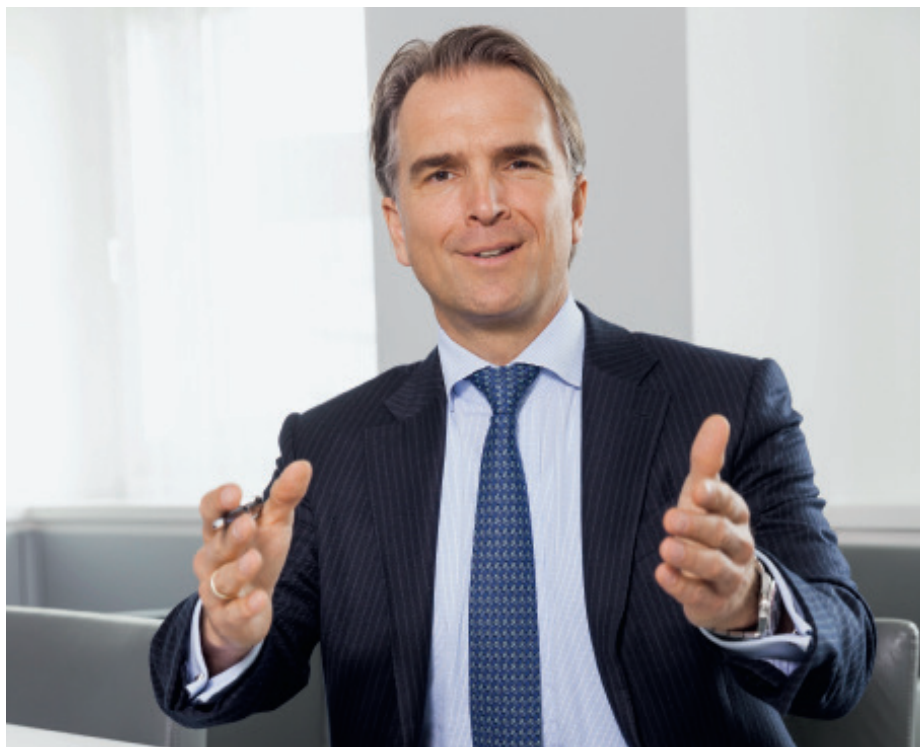
12 TITEL: Multi Asset Fonds sind für Werner Kolitsch, Chef von M&G Investments in Deutschland und Österreich, aufgrund ihrer flexiblen Aufstellung das optimale Investment, wenn die Unsicherheit und Nervosität an den Märkten weiter zunimmt