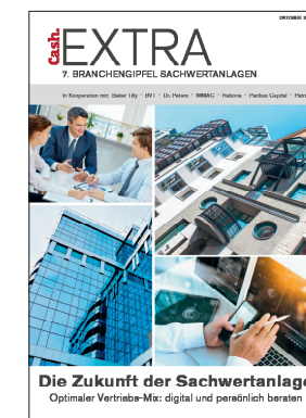
Cash.Extra 7. Branchengipfel Sachwertanlagen